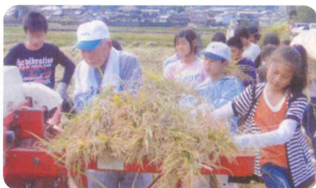
脱穀が最後の仕事です。