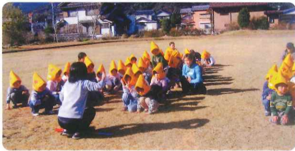
斗賀野中央保育園