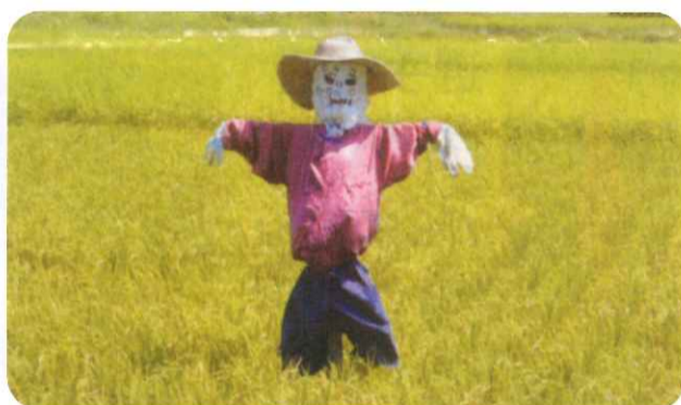
ただいまお仕事中。