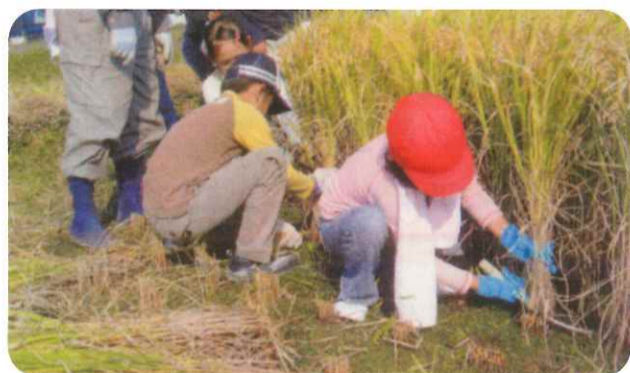
うまく刈れるかな。