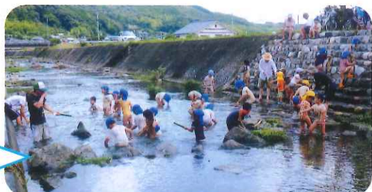
きれいになった姉ヶ瀬川での水鉄砲遊び。

斗賀野中央保育園児へと地元おじいちゃんたちとの交流として水鉄砲遊び、舟流し、魚捕りを行いました。