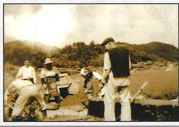
幸田川の橋梁工事（下美都岐時広前農道）