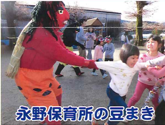
永野保育所の豆まき