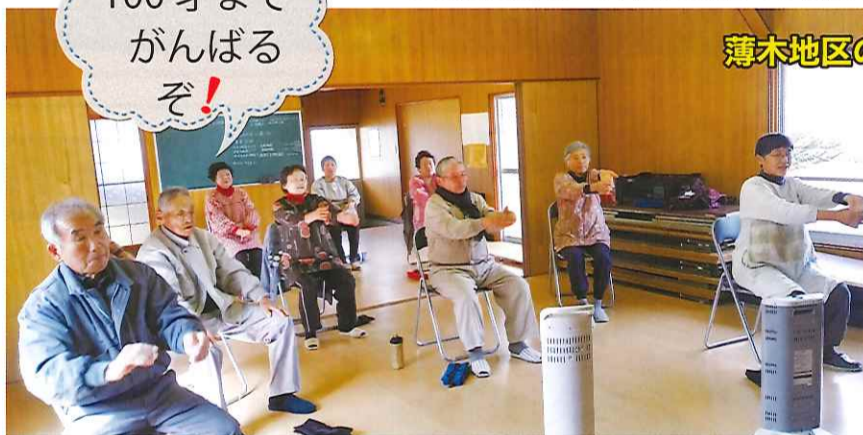
薄木地区のみなさん