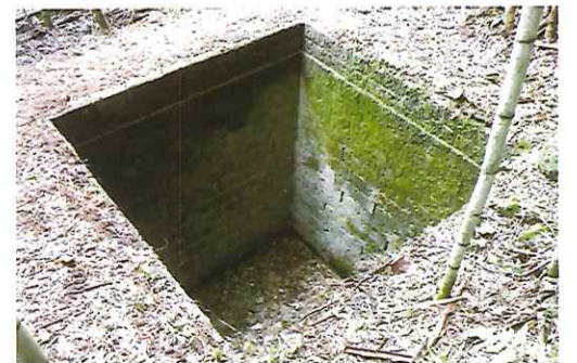
●斗賀野文化の会歴史掘り起し部●